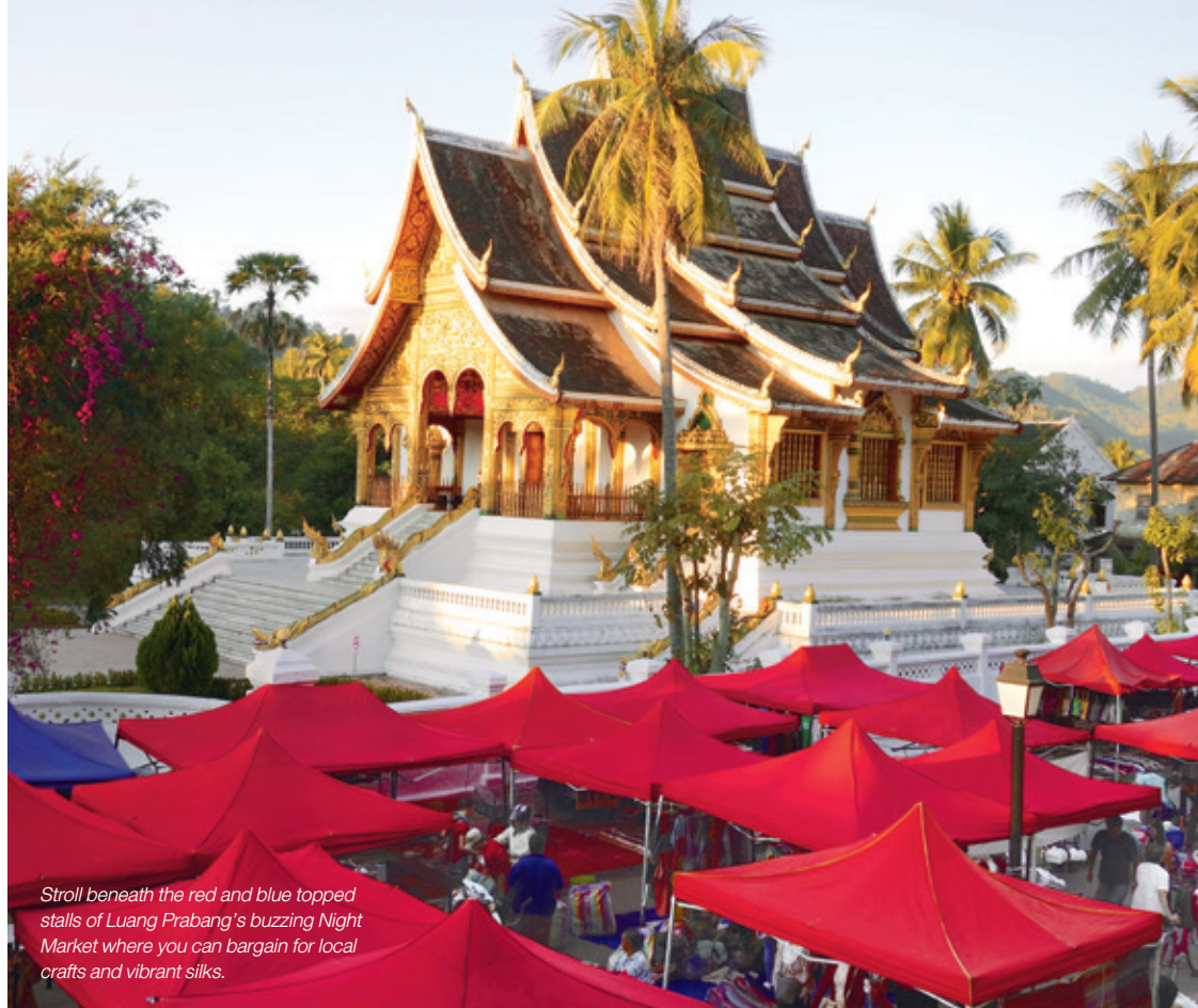
Stroll beneath the red and blue topped stalls of Luang Prabang's buzzing Night Market where you can bargain for local crafts and vibrant silks.