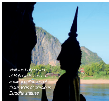
Visit the holy caves at Pak Ou to see an ancient collection of thousands of precious Buddha statues.