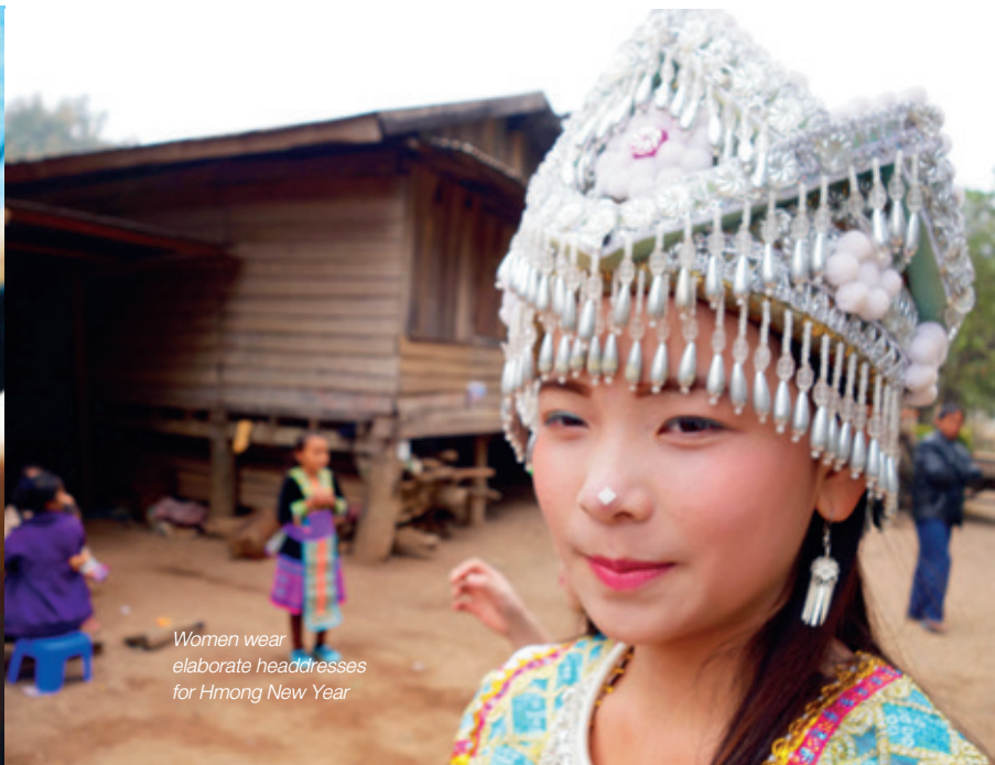
Women wear elaborate headdresses for Hmong New Year

There's a sudden cheer and it's over. The villagers come forward and each ties a piece of string around our wrists; forty pieces of cotton we must keep on for three days. The ceremony was a surprise offered to us by the village elders; I look at my fellow cycle adventurers and albeit relieved to stretch their legs, they are smiling broadly. Through lit up eyes, I see eleven enriched souls.