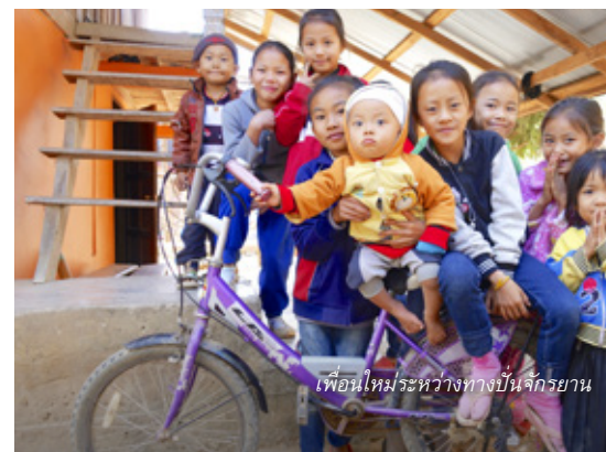
เพื่อนใหม่ระหว่างทางปั่นจักรยาน

มีคนว่าไว่ว่ายิ่งห่างไกลใจยิ่งคิดถึง และฉันก็เริ่มคิดถึงความหรูหรางดงามของทัศนียภาพแบบวิวเฝ้าเบื้องหลังแฮนด์จักรยานและตั้งหน้าตั้งตารอที่จะได้กลับไปสานสัมพันธ์อันล้ำค่ากับเจ้าจักรยานที่รักของฉันอีกครั้งหนึ่ง