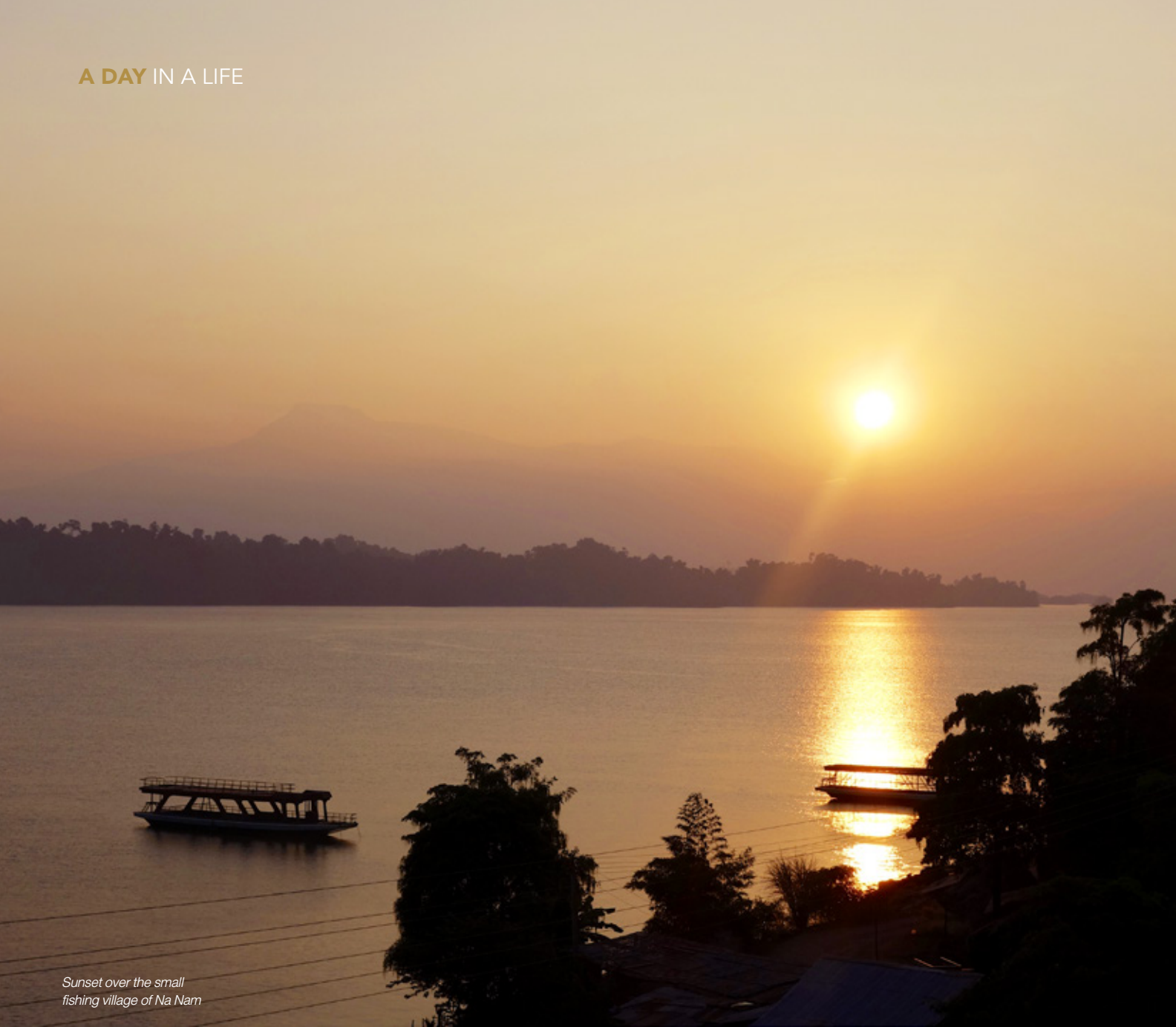
Sunset over the small fishing village of Na Nam