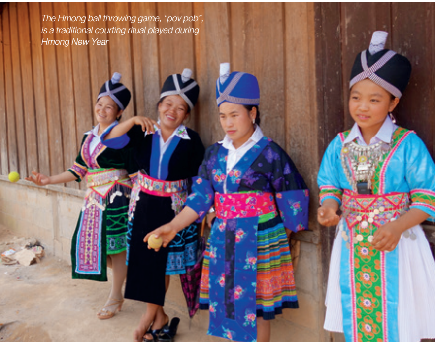
The Hmong ball throwing game, "pov pob", is a traditional courting ritual played during Hmong New Year