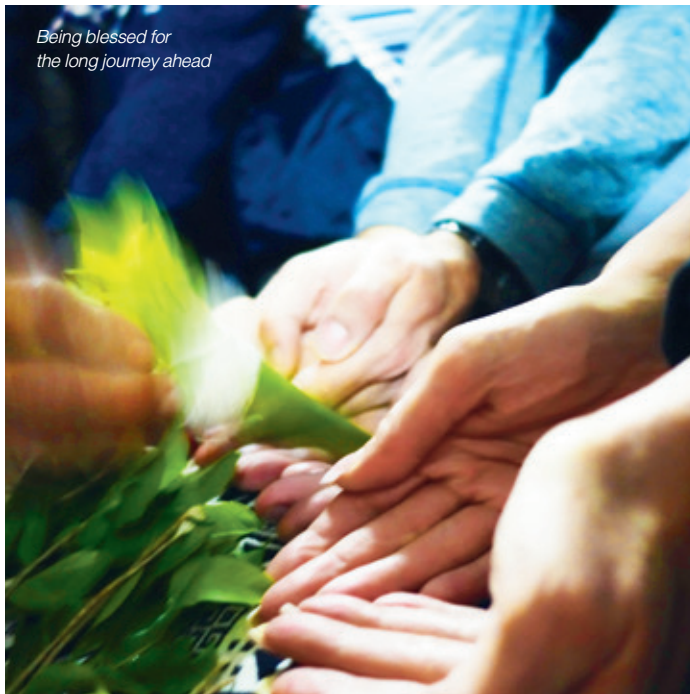
Being blessed for the long journey ahead