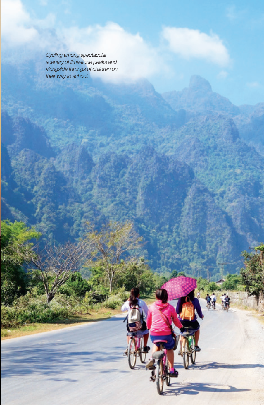
Cycling among spectacular scenery of limestone peaks and alongside throngs of children on their way to school.