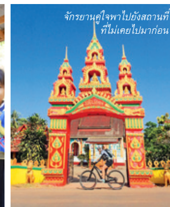
จักรยานคู่ใจพาไปยังสถานที่ที่ไม่เคยไปมาก่อน